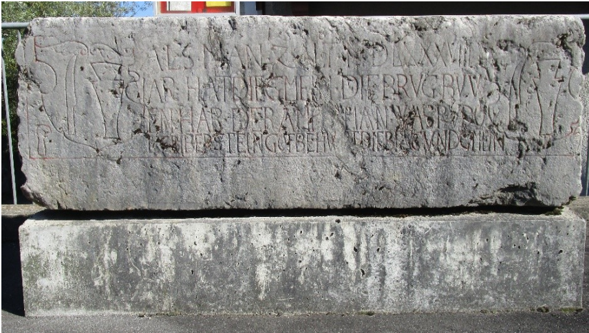
La pierre armoiriée depuis 2009

Nous remercions vivement nos sponsors du soutien :